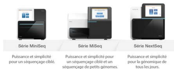
Figure 3 : Gamme de paillasse de SNG d'Illumina : les systèmes de SNG d'Illumina proposent des solutions pour pratiquement toutes les applications et tous les types d'échantillons et d'échelles de séquençage. Ils fournissent tous des données de grande qualité, un degré d'exactitude élevé, de la souplesse sur le plan du débit et des flux de travail simples et rationalisés. Les données peuvent être facilement comparées, échangées et analysées sans difficulté dans BaseSpace Sequence Hub.

Le système MiniSeq s'appuie sur la suite intégrale de solutions de préparation de librairies proposée par Illumina, permettant la compatibilité des librairies avec toute la gamme de séquençage d'Illumina. Cela permet aux chercheurs de mettre à l'échelle facilement les études en vue d'un passage aux systèmes de séquençage NextSeq MC , dont le débit est plus élevé, ou d'effectuer des études de suivi sur les systèmes de séquençage MiSeq MC (Figure 3).