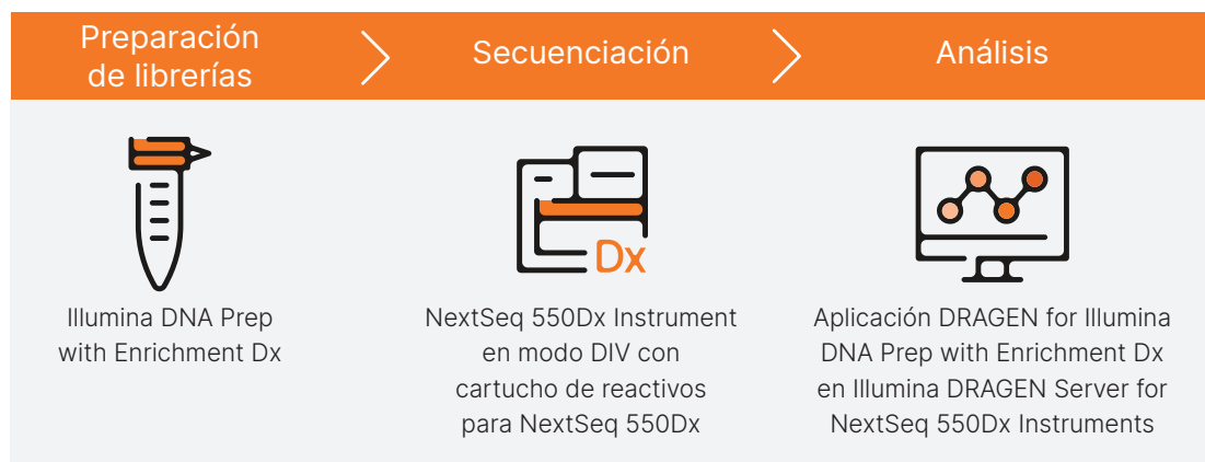
Figura 1: Análisis por NGS conforme al IVDR de muestras en DRAGEN Server for NextSeq 550Dx Instruments: El flujo de trabajo de secuenciación selectiva incluye la preparación de librerías de muestras extraídas con el flujo de trabajo de NGS de Illumina DNA Prep with Enrichment Dx, la secuenciación en NextSeq 550Dx Instrument y el análisis preciso conforme al IVDR realizado en DRAGEN Server for NextSeq 550Dx Instrument.