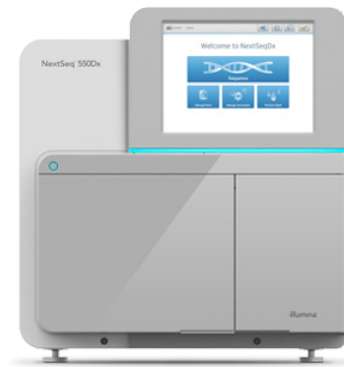
Figura 2: NextSeq 550Dx Instrument: NextSeq 550Dx Instrument ofrece resultados de alta calidad tanto para aplicaciones clínicas como de investigación.

NextSeq 550Dx Instrument es un potente sistema de secuenciación de sobremesa creado para satisfacer las necesidades de los laboratorios clínicos (figura 2). NextSeq 550Dx Instrument es un sistema de diagnóstico in vitro (DIV) regulado por la FDA y con certificación CE que permite a los laboratorios de diagnóstico desarrollar y realizar ensayos de DIV de NGS que abarcan desde paneles selectivos hasta exomas completos. NextSeq 550Dx Instrument cuenta con una funcionalidad de doble arranque que incluye un modo de diagnóstico, o modo Dx, y un modo de investigación. Estos dos modos aportan flexibilidad para el desarrollo de pruebas de DIV y pruebas desarrolladas en el laboratorio (LDT, laboratory developed tests), así como para la investigación clínica en un único instrumento.