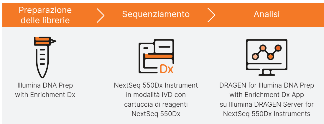
Figura 1: analisi NGS conforme a IVDR dei campioni sul DRAGEN Server for NextSeq 550Dx Instruments. Il flusso di lavoro di sequenziamento mirato include la preparazione delle librerie di campioni estratti con il flusso di lavoro NGS di Illumina DNA Prep with Enrichment Dx, il sequenziamento sul NextSeq 550Dx Instrument e l'accurata analisi conforme al regolamento IVDR eseguita sul DRAGEN Server for NextSeq 550Dx Instrument.