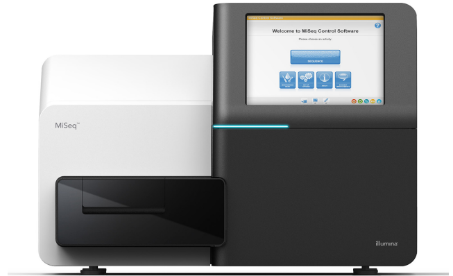
Figura 1: Sistema MiSeq - Il sistema MiSeq compatto consente un sequenziamento di prossima generazione rapido e conveniente.

Il sistema MiSeq offre la prima piattaforma per il sequenziamento dal DNA ai dati che integra in un unico strumento generazione di cluster, amplificazione, sequenziamento e analisi dei dati. L'ingombro ridotto (circa 0,18 metri quadrati) consente di posizionare lo strumento praticamente in qualsiasi ambiente di laboratorio (Figura 1). Il sistema MiSeq sfrutta la chimica di sequenziamento mediante sintesi (SBS) di Illumina, una collaudata tecnologia di sequenziamento di prossima generazione (NGS) che ormai genera più del 90% dei dati di sequenziamento al mondo. 1 La potenza della tecnologia NGS e la forma compatta dello strumento fanno del sistema MiSeq la piattaforma ideale per un'analisi genetica rapida ed economicamente vantaggiosa.