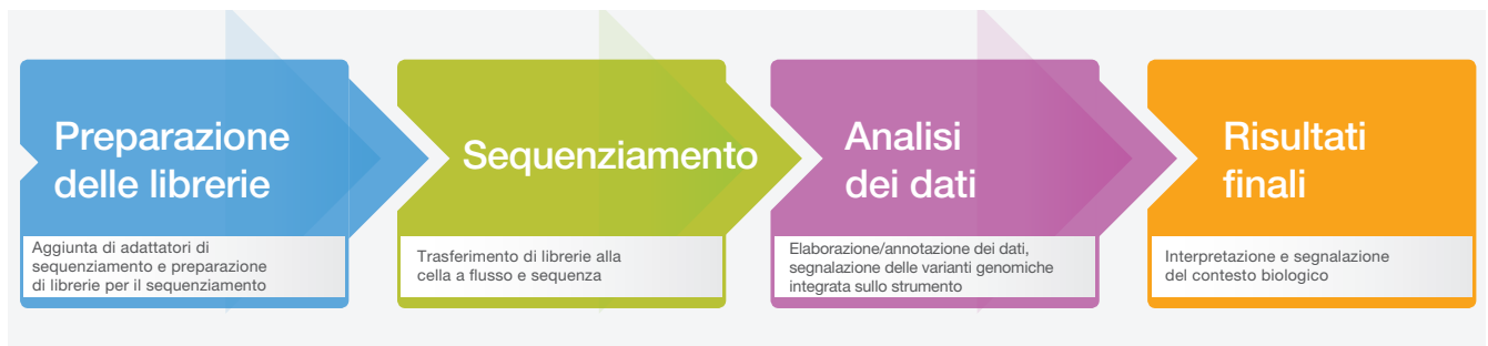
Figura 2: Flusso di lavoro del sistema MiSeq - Il flusso di lavoro ottimizzato del sistema MiSeq assicura tempi di elaborazione rapidi per il sequenziamento da banco di prossima generazione. Le librerie possono essere preparate con qualsiasi kit di preparazione librerie compatibile. Nel tempo di sequenziamento di cinque ore e mezza vengono eseguiti: generazione di cluster, sequenziamento e identificazione delle basi qualitativamente valutata con scansione a doppia superficie per una corsa di 2 × 25 coppie di basi su un sistema MiSeq con software di controllo MiSeq.

Tutti i sistemi MiSeq consentono l'analisi integrata dei dati e l'accesso a BaseSpace™ Sequence Hub, la piattaforma di calcolo genomico sul cloud di Illumina. BaseSpace Sequence Hub fornisce caricamento dei dati in tempo reale, semplici strumenti di analisi dei dati, monitoraggio della corsa basato su Internet e una soluzione di archiviazione sicura e scalabile. Grazie a una suite di strumenti di analisi dei dati e a una serie crescente di app di analisi di terze parti, i ricercatori possono eseguire tutte le operazioni necessarie. BaseSpace Sequence Hub consente inoltre di condividere i dati con colleghi o clienti in modo facile e veloce.