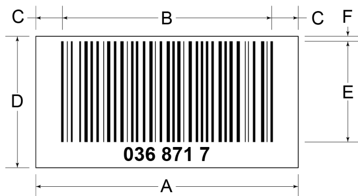
Slika 2 Dimenzije bar-koda