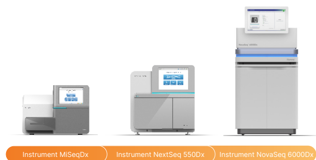
Figure 2 : Performance optimisée pour diverses plateformes validées : ces instruments de DIV marqués CE et réglementés par la FDA offrent une interface conviviale, une sécurité renforcée et des résultats de haute qualité pour les applications cliniques.

ILLUMINA DNA Prep with Enrichment Dx est compatible avec les instruments MiSeq MC Dx NextSeq MC 550Dx et NovaSeq MC 6000Dx ( figure 2 ). Ces plateformes de diagnostic in vitro réglementées par la FDA et à marquage Conformité Européenne (dispositifs de DIV marqués CE) sont conçues pour apporter la puissance du SNG au sein des laboratoires cliniques. En exploitant la chimie de séquençage par synthèse (SBS, sequencing by synthesis) éprouvée d'ILLUMINA, ces instruments fournissent des résultats de tests diagnostiques très précis et fiables.