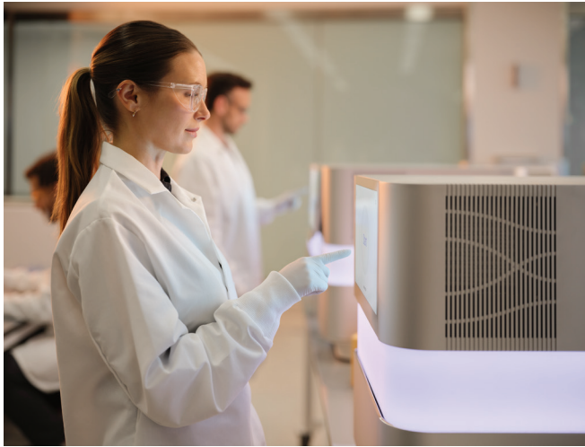
図2: 経験豊富なイルミナのフィールドサービススタッフが適格性評価サービスを実施し、ラボの生産性を最大化し、ターンアラウンドタイムを短縮し、規制遵守を維持できるようにします。