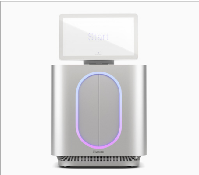
图1: MiSeq™ i100系列测序仪 凭借极简设计的桌面测序仪，因美纳的创新技术不断扩展NGS的可及性。

即插即用试剂卡盒和耗材可在室温下运输和储存，因此测序前无需等待试剂解冻。直观的信息学分析大幅减少了手动操作，并且无需专业生物信息学家介入，有效简化分析，让新用户和高级用户都可以从中受益。