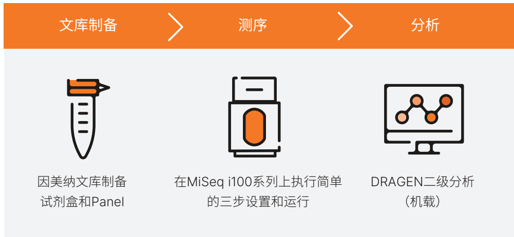
图2: MiSeq i100和MiSeq i100 Plus基因测序仪提供了直观、简便的分析流程, 可简化过渡至NGS的过程。