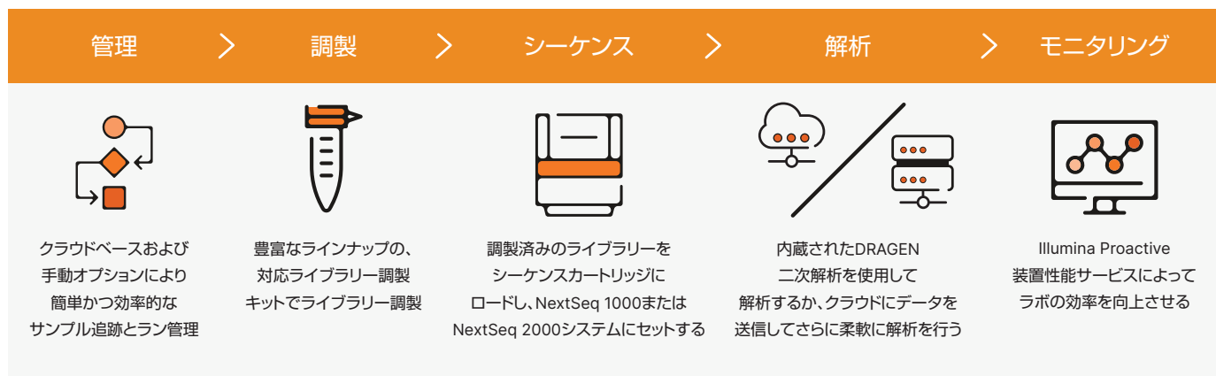
図2: ライブラリー調製から解析までの直感的なワークフロー: NextSeq 1000およびNextSeq 2000システムのワークフローは、簡単なランセットアップ、対応ライブラリー調製キットの幅広いエコシステム、ロードしてランするだけの簡単操作、システムでの二次解析までを包括的にカバーします。

c. クオリティスコアはイルミナPhiXコントロールライブラリーを用いた条件に基づきます。パフォーマンスはライブラリータイプやクオリティ、インサートサイズ、ローディング濃度、およびその他の実験要因に応じて変わることがあります。