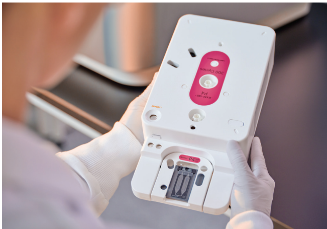
図4：NextSeq 1000およびNextSeq 2000試薬カートリッジ：カートリッジは、試薬、フルイデックス、廃液ホルダーが一体化されています。試薬カートリッジを融解して準備し、フローセルを挿入してライブラリーをロードし、装置にセットするだけです。

試薬はカートリッジから出ることなく、ドライ装置には洗浄が必要ない設計が施されているため、装置メンテナンスの効率化が可能となり、装置の効率性を最適化します。