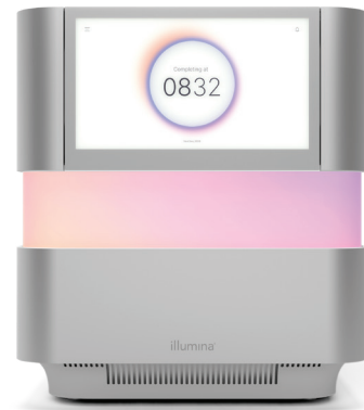
図1: NextSeq 2000シーケンスシステム: NextSeq 2000システムは、革新的なデザイン特性、先進のケミストリー、シンプルなバイオインフォーマティクス、直感的なワークフローを備え、きわめて幅広いシーケンスアプリケーションとスケールの柔軟性をベンチトップで実現します。

NextSeq 1000およびNextSeq 2000システムは、標準的なイルミナSBSケミストリーの実績の基盤の上に構築された、より高速かつ高品質で、よりロバストなSBSケミストリーであるXLEAP-SBSケミストリーを採用しています。XLEAP-SBSヌクレオチドは、最新式の色素と新規リンカーおよび耐熱性が向上したブロッキング剤を使用することで、加水分解が50倍低下し、ブロッキング切断が2.5倍速くなり、フェージングとプレフェージングを減少させることができます。XLEAP-SBSポリマーゼはより速く、これまでになく