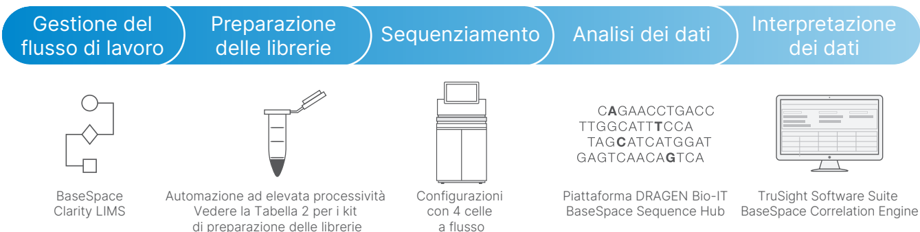
Figura 4: Flusso di lavoro NGS NovaSeq 6000 System: il NovaSeq 6000 System è compatibile con BaseSpace Clarity LIMS, con la gamma di kit di preparazione delle librerie Illumina, con il supporto per i "metodi qualificati" Illumina, con le soluzioni di analisi dei dati come la piattaforma DRAGEN Bio-IT e BaseSpace Sequence Hub e con gli strumenti di interpretazione dei dati a valle come TruSight Software Suite e BaseSpace Correlation Engine.

Bio-IT per l'analisi secondaria ultra rapida e accurata dei dati NGS oppure accedere alle applicazioni BaseSpace per l'allineamento e il rilevamento delle varianti, l'annotazione, la visualizzazione e altro. Per altre opzioni di analisi, incluse le pipeline presenti in laboratorio, NovaSeq System Software genera identificazioni delle basi e punteggi qualitativi convertiti in file FASTQ per l'analisi a valle.