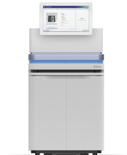
Figura 1: NovaSeq 6000 System: trasforma il sequenziamento unendo processività, flessibilità e facilità di utilizzo per quasi tutti i metodi, i genomi e le scale.

Il NovaSeq 6000 System offre output fino a 6 Tb e 20 miliardi di letture per una doppia corsa S4 in meno di due giorni. Diverse combinazioni di tipi di cella a flusso e lunghezza di lettura consentono di ottenere configurazioni flessibili per gli output e le durate delle corse in base alle esigenze del progetto (Tabella 1).