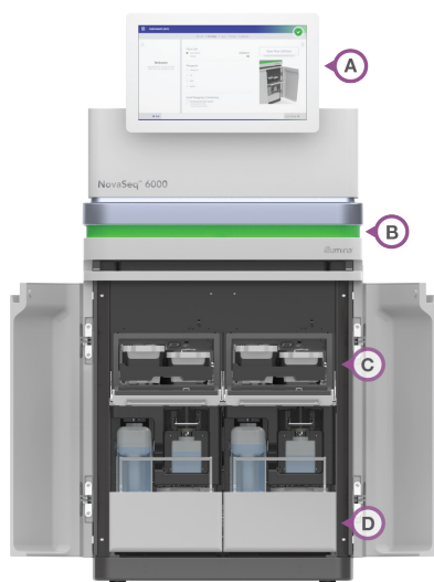
Figura 3: Funzionamento ottimizzato: molte caratteristiche del NovaSeq 6000 System sono progettate per semplificare gli studi di genomica, inclusi (A) l'interfaccia intuitiva su touch screen, (B) il display LED dotato di spie luminose che indica lo stato della cella a flusso, (C) le cartucce sagomate contenenti i reagenti pronti all'uso e (D) i contenitori per gli scarti facili da rimuovere e smaltire.