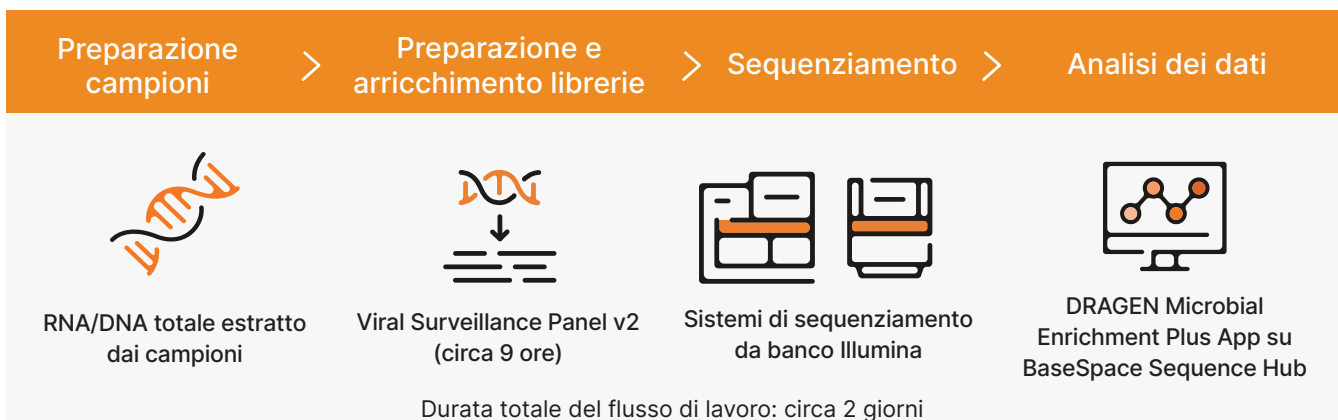
Figura 1: flusso di lavoro di Viral Surveillance Panel v2. Grazie a un flusso di lavoro completo e ottimizzato, le librerie vengono preparate a partire da campioni host o ambientali, sequenziate su un sistema di sequenziamento Illumina e analizzate con DRAGEN Microbial Enrichment Plus App per il rilevamento virale, la generazione di letture consenso sull'intero genoma, la mappatura delle letture sulle migliori identificazioni virali e la tipizzazione dei ceppi. La durata del sequenziamento varia in base alla profondità di lettura del campione e al sistema di sequenziamento utilizzato.

Il flusso di lavoro per la preparazione delle librerie di Viral Surveillance Panel v2 comprende fasi di pre-arricchimento e arricchimento. Il pre-arricchimento genera centinaia di migliaia di librerie non mirate arricchite con sonde Viral Surveillance Panel v2 utilizzando un approccio mediante ibridazione-cattura. L'arricchimento con tagmentazione su microsferi fornisce un rapido flusso di lavoro compatibile con l'automazione e che può essere completato in circa due giorni con interventi manuali minimi. Il protocollo supporta quantità di input di campioni che vanno da 10 ng a 100 ng di acido nucleico totale e supporta il multiplex di un massimo di 384 campioni in una singola esecuzione.