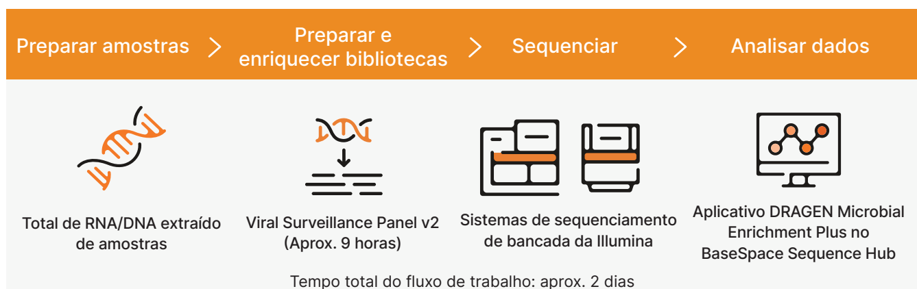
Figura 1: fluxo de trabalho do Viral Surveillance Panel v2. Em um fluxo de trabalho simplificado e abrangente, as bibliotecas são preparadas a partir de amostras ambientais ou hospedeiras, sequenciadas em um sistema de sequenciamento da Illumina e analisadas com o aplicativo DRAGEN Microbial Enrichment Plus quanto à detecção viral, geração de consenso de genoma completo, leitura de mapeamento quanto aos melhores resultados virais e tipagem de cepa. O tempo de sequenciamento varia com a profundidade de cobertura da amostra e o sistema de sequenciamento usado.

O fluxo de trabalho de preparação da biblioteca do Viral Surveillance Panel v2 consiste em etapas de pré-enriquecimento e enriquecimento. O pré-enriquecimento gera centenas de milhares de bibliotecas não direcionadas que são enriquecidas com sondas Viral Surveillance Panel v2, usando uma abordagem de captura híbrida. O enriquecimento com tagmentação em bead fornece um fluxo de trabalho rápido e compatível com automação que pode ser completado em aproximadamente dois dias com o mínimo de tempo de trabalho efetivo. O protocolo acomoda quantidades de entrada de amostras que variam de 10 ng a 100 ng de ácido nucleico total e é compatível com a multiplexação de até 384 amostras em uma execução única.